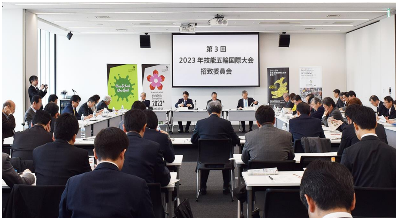
オールジャパン体制での2023年技能五輪国際大会の招致に向け、平成31年2月21日、名古屋市内で第3回 2023年技能五輪国際大会招致委員会が開催されました。