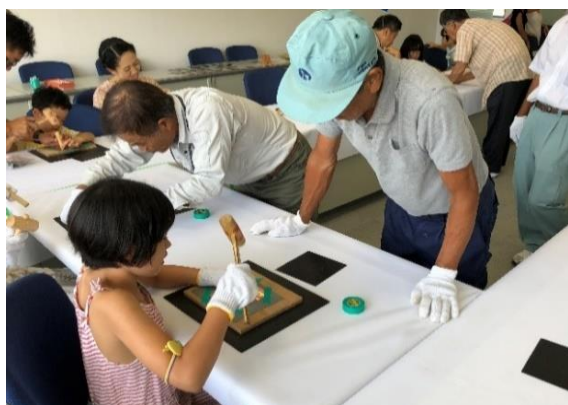
好きな絵柄を銅板に打ち込んでいます。(板金コーナー)