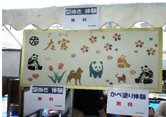
壁塗り体験もできます。(左官コーナー)