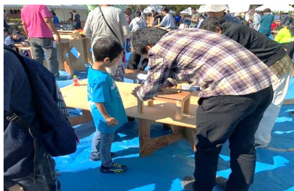
親子で踏み台づくりに夢中。(木工コーナー)