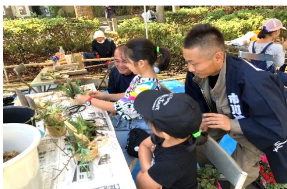
職人さんと一緒に門松づくり。(造園コーナー)