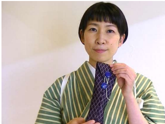
まずは簡単なペンケース