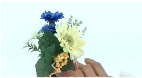
かわいいコサージュ