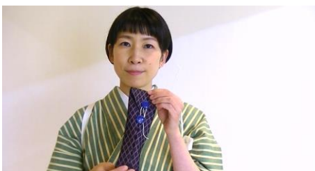
まずは簡単なペンケース