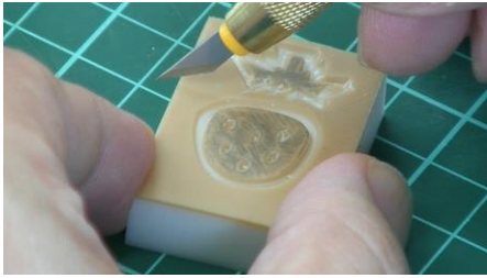
まずは簡単なイチゴのはんこ