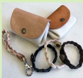
革細工：コインパース