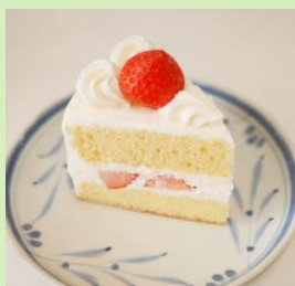
洋菓子：ケーキのデコレーション