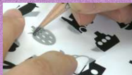
トレーシングペーパーに、絵をなぞる。