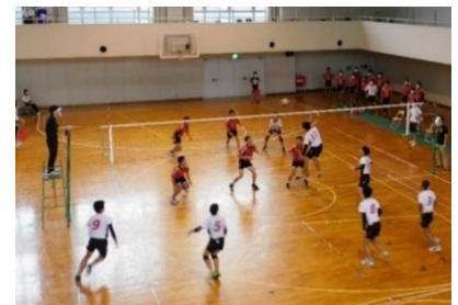
事業所部会有志による独自体育大会

また、令和2年9月4日(金)及び8日(火)には、事業所部会の有志で独自の体育大会を開催しました。訓練生たちは、ソフトボールやバレーボールなど6種目で、自粛期間中に蓄えた力を存分に発揮し、熱戦を繰り広げました。