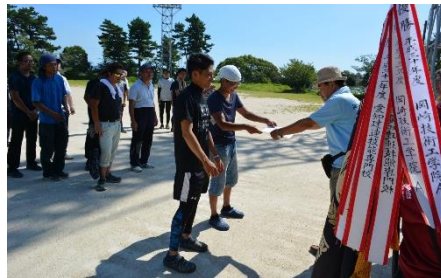
共同訓練部会訓練生 ソフトボール大会

また、令和2年9月4日(金)及び8日(火)には、事業所部会の有志で独自の体育大会を開催しました。訓練生たちは、ソフトボールやバレーボールなど6種目で、自粛期間中に蓄えた力を存分に発揮し、熱戦を繰り広げました。